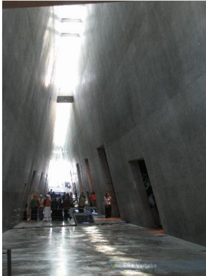
Foto van het nieuwe Museum van de Geschiedenis van de Holocaust. Het museum bestaat uit een betonnen structuur, zonder enige verdere opmaak, in de vorm van een prisma. Het licht komt binnen via uitsparingen in het dak en een uitzicht over Jeruzalem.

https://www.kuleuven.be/thomas/page/fotodatabank/view/26650/